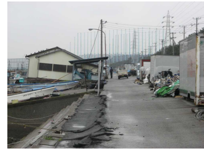
漁港施設の傾斜 舗装面の沈下・亀裂