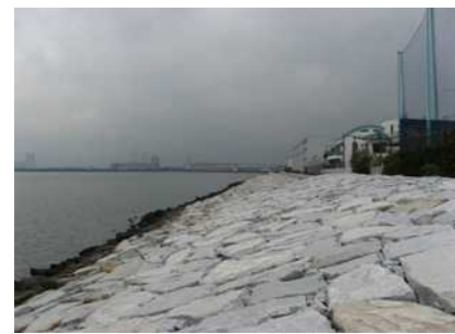
【塩浜2丁目護岸】 目立った被害はない