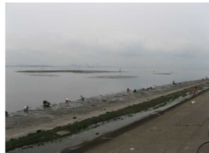
干潟の干出域が縮小