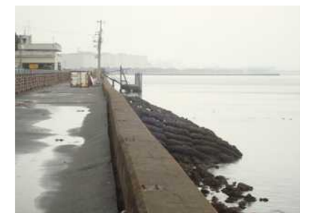
【市川市行徳漁協付近】