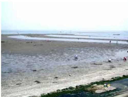
図2-1-3 浦安市日の出地先の干潟