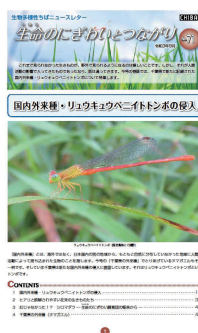
生物多様性センター広報紙 「生命のにぎわいとつながり」

県ホームページや広報紙、環境イベント等を通じ、正確な知識と対策を周知するため情報発信を行っています。