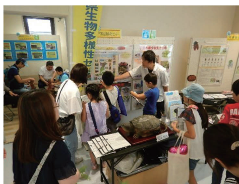
環境イベントへの出展・解説