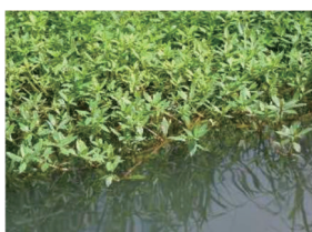
ナガエツルノゲイトウ