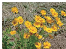
オオキンケイギク