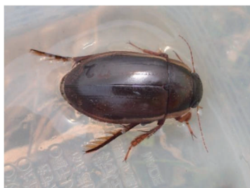
シャープゲンゴロウモドキ