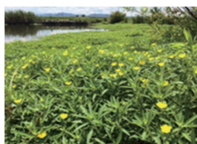
オオバナミズキンバイ