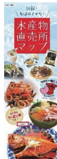
水産物直売所マップ

「水産物直売所マップ」を作成し、首都圏のJR主要駅や高速道路のSA・PAなどに配布・設置するほか、千葉県のホームページで県内の潮干狩り場を紹介するなど、都市住民の漁村への来訪を促しました。