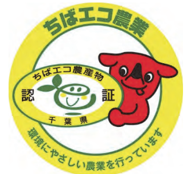
環境にやさしい農業 （ちばエコ）ロゴマーク

「環境にやさしい農業」として、持続農業法に基づくエコファーマーの認定、「ちばエコ農業」制度、有機農業推進法に基づく有機農業の3つを位置づけ、一体的に推進しました。特に、県独自の認証制度である「ちばエコ農業」制度では、化学合成農薬や化学肥料を通常の2分の1以下に低減し栽培された農産物を「ちばエコ農産物」として、3,576ha認証を行いました。また、国が創設した「環境保全型農業直接支払交付金」を活用し、地球温暖化防止や生物多様性保全に効果の高い営農活動に取り組む農業者に対して交付金を交付しました（23市町、458ha）。