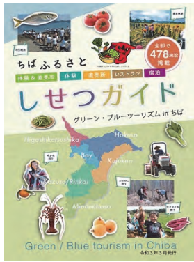
「グリーン・ブルーツーリズム in ちば」 パンフレット