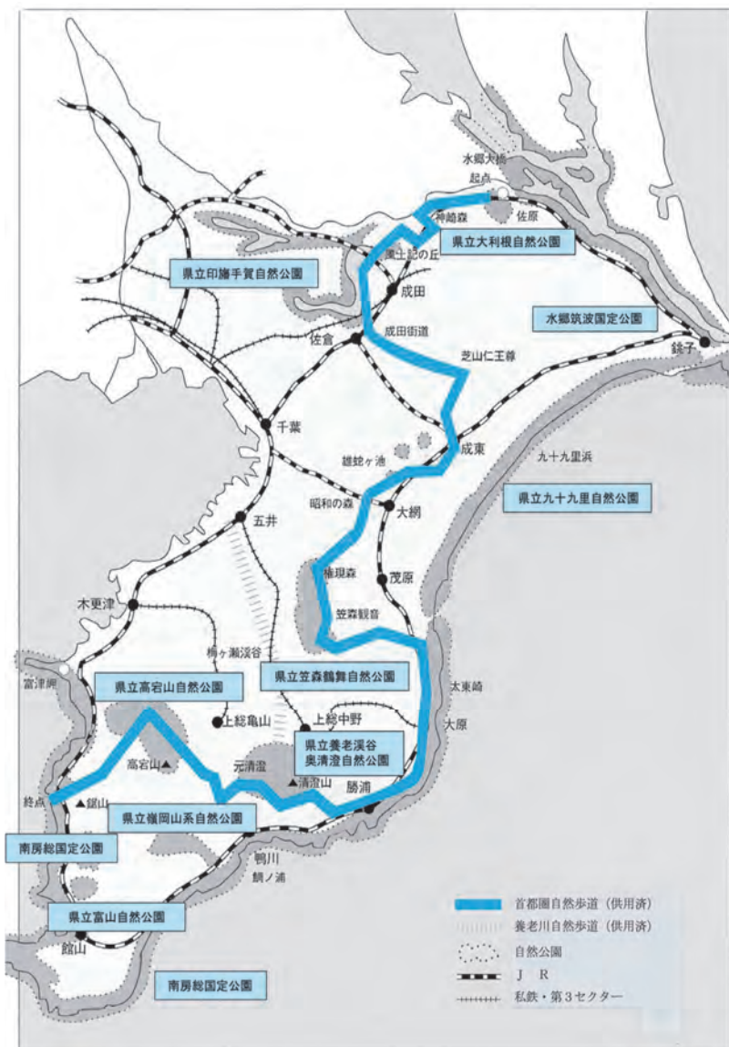
図表 3-2-1 自然公園等位置図

自然公園等の優れた自然環境が人為的な影響により失われることのないよう適切に保全していくとともに、人と自然とのふれあいの場、環境について学ぶ場として、より一層活用していくことが必要です。