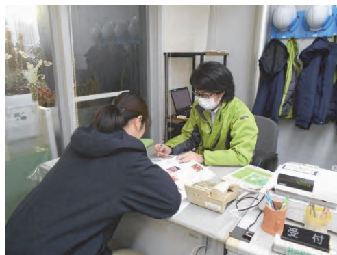
緑の相談所（県立北総花の丘公園）