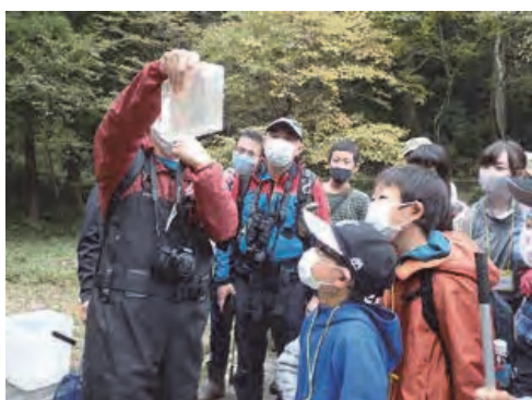
生物多様性を体感する現地研修会

生物多様性等に関する千葉県と大学との連携に関する協定を締結している8大学(江戸川大、千葉大、千葉科学大、千葉工業大、東京大、東京海洋大、東京情報大、東邦大)と連携した生物多様性に関する研究や研究成果発表会を開催しました。なお、新型コロナウイルス感染症対策のため、インターンシップ実習生の受入れは見送ることとなりました。