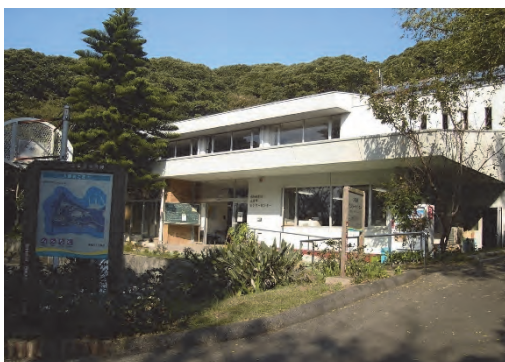
大房岬自然公園施設ビジターセンター