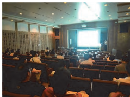
生物多様性に関する研修会