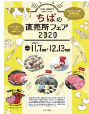
「ちばの直売所フェア 2020」 パンフレット