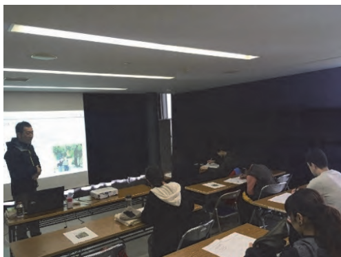
緑の教室（県立北総花の丘公園）

また、2020年度の県民向けのイベントは新型コロナウイルス感染症の影響により中止となりました。