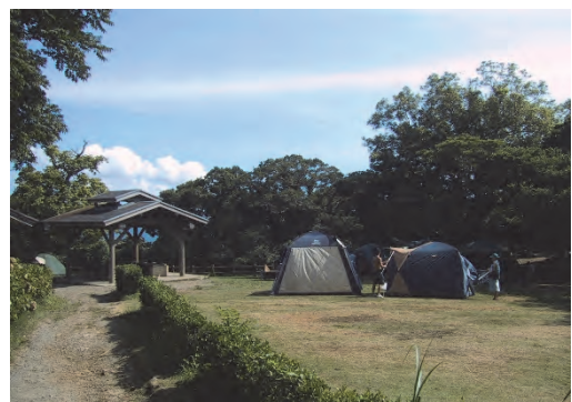
大房岬自然公園施設野営場