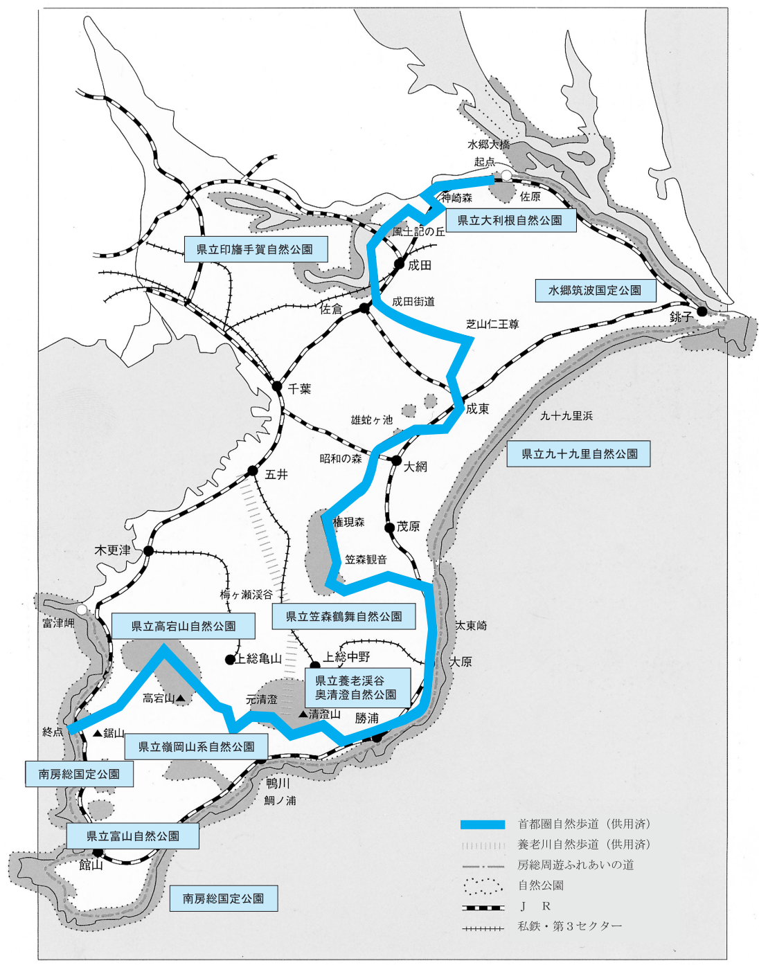
図 2-3-2 自然歩道概要図