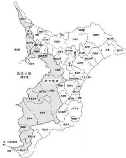
図 3.2-11 水質汚濁防止法による指定地域

「水質汚濁防止法第3項」の規定による指定地域は、図3.2-11に示すとおりです。事業実施想定区域及びその周囲においては、市川市、船橋市、鎌ヶ谷市、松戸市、八千代市の一部が該当します。