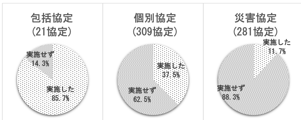
図表5 県における取組・成果等の情報発信

なお、包括協定と災害協定では、4割以上で自動更新（協定当事者間において異議がなければ自動的に終期を延長）する仕組みとなっていた。