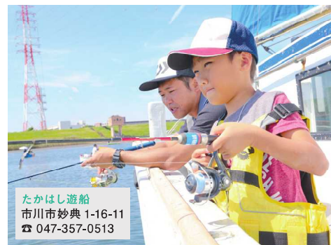
たかはし遊船 市川市妙典 1-16-11 ☎ 047-357-0513