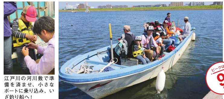
江戸川の河川敷で準備を済ませ、小さなボートに乗り込み、いざ釣り船へ！