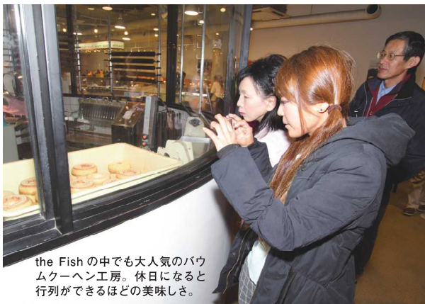
the Fishの中でも大人気のバウムクーヘン工房。休日になると行列ができるほどの美味しさ。