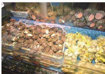
the Fish 富津市金谷 2288 ☎ 0439-69-2161