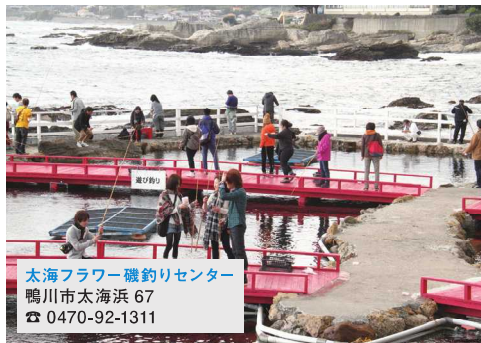
大海フラワー磯釣りセンター 鴨川市太海浜 67 ☎ 0470-92-1311

遊び釣りの場合は釣った魚はリリース。買い取りすれば、家に持ち帰ったり、併設のレストランで料理してもらうことも可能です。