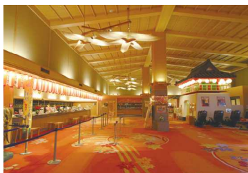
龍宮城スパホテル三日月 木更津市北浜1 ☎ 0438-41-8111