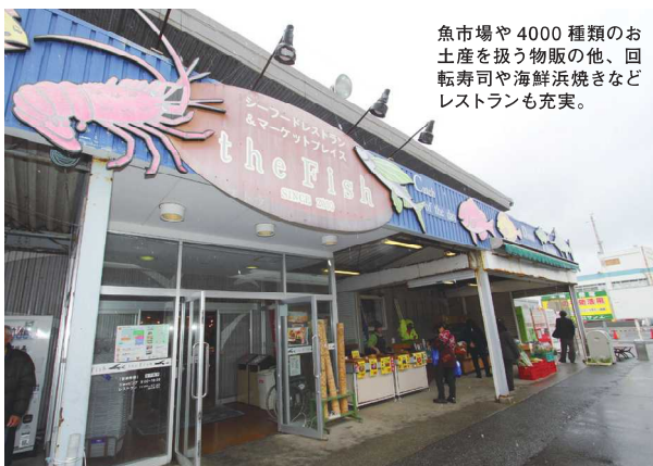
魚市場や4000種類のお土産を扱う物販の他、回転寿司や海鮮浜焼きなどレストランも充実。