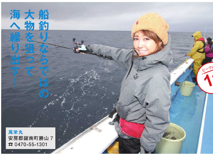
萬栄丸 安房郡鋸南町勝山7 ☎ 0470-55-1301

勝山港から出航した萬栄丸は最新装備を搭載しており、快適な船釣りを楽しむことができます。