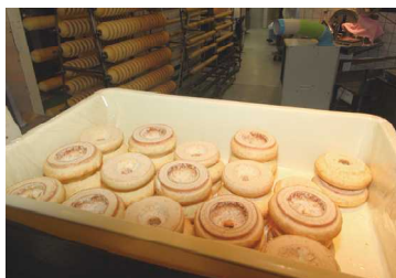
見波亭 富津市金谷2288 (theFish内) ☎0439-69-8373