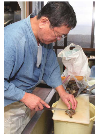
多くの釣り人が釣果を持って訪れる「おしなや」。その魚の一番美味しい調理方法で料理を提供してくれます。