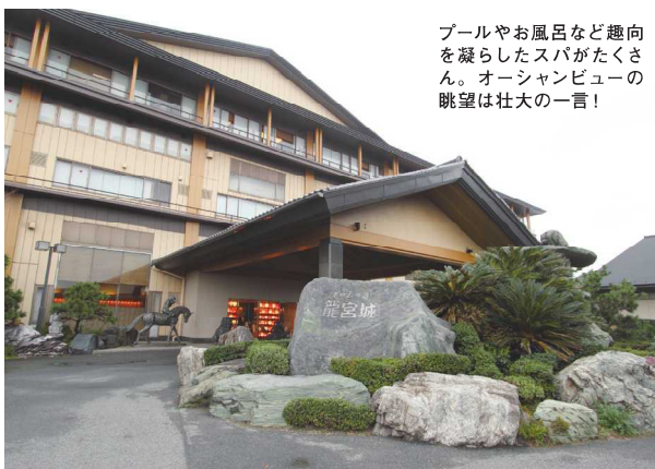
プールやお風呂など趣向を凝らしたスパがたくさん。オーシャンビューの眺望は壮大の一言!