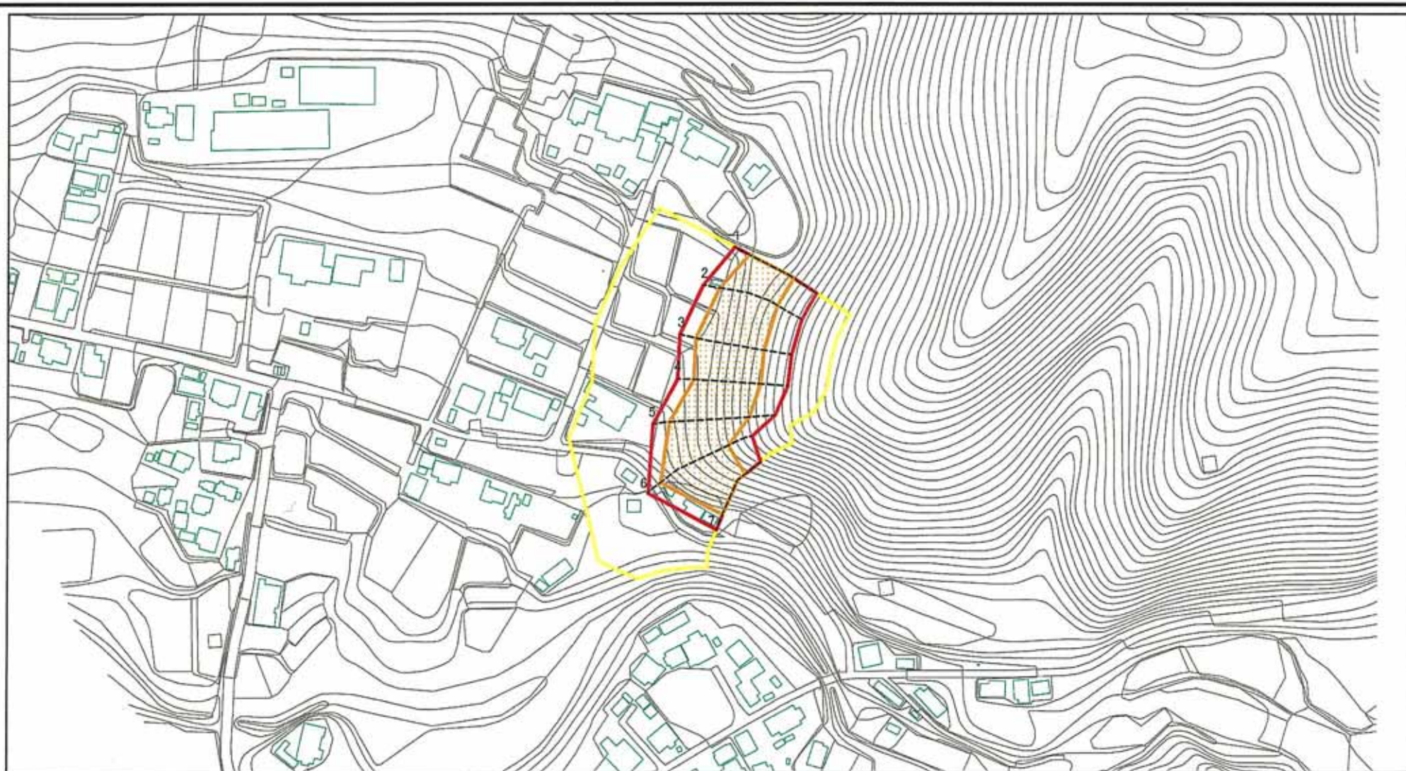
図中の数字は横断測線番号を示す