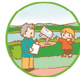
県管理河川などの 公共施設の確認