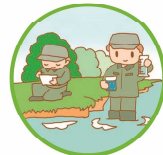
環境調査や環境学習