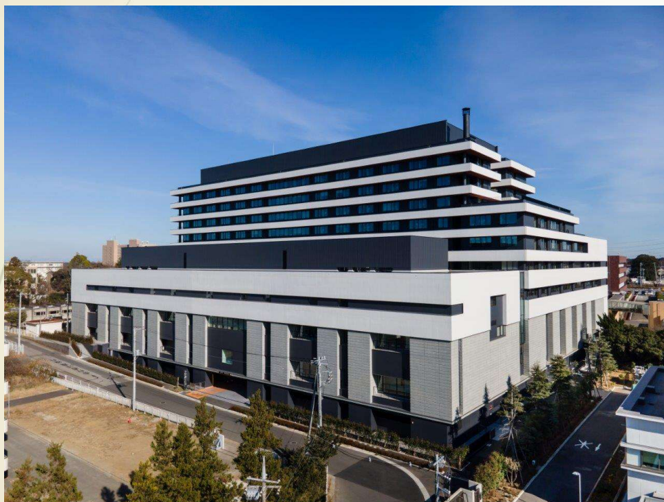
千葉県がんセンター新棟建築工事 【令和2年度竣工】