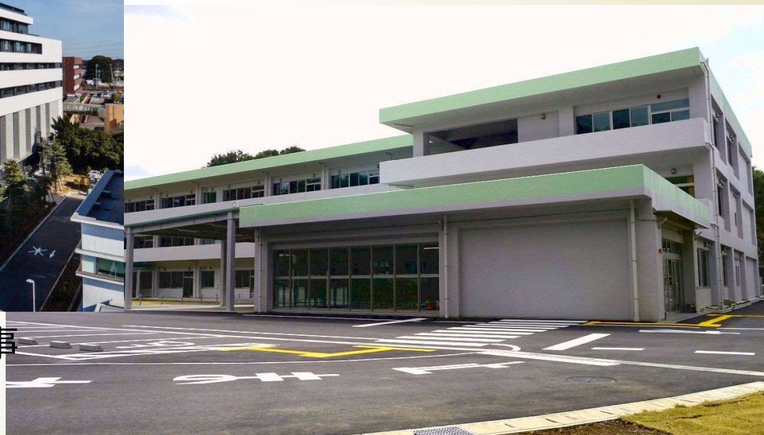
東葛の森特別支援学校建築工事 【令和3年度竣工】