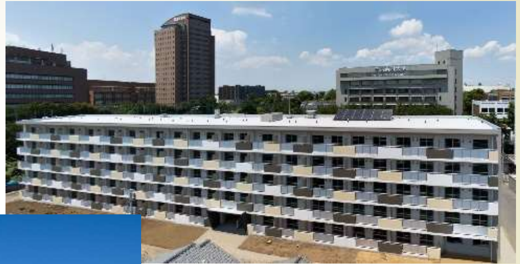
国府台県営住宅 【令和元年度竣工】