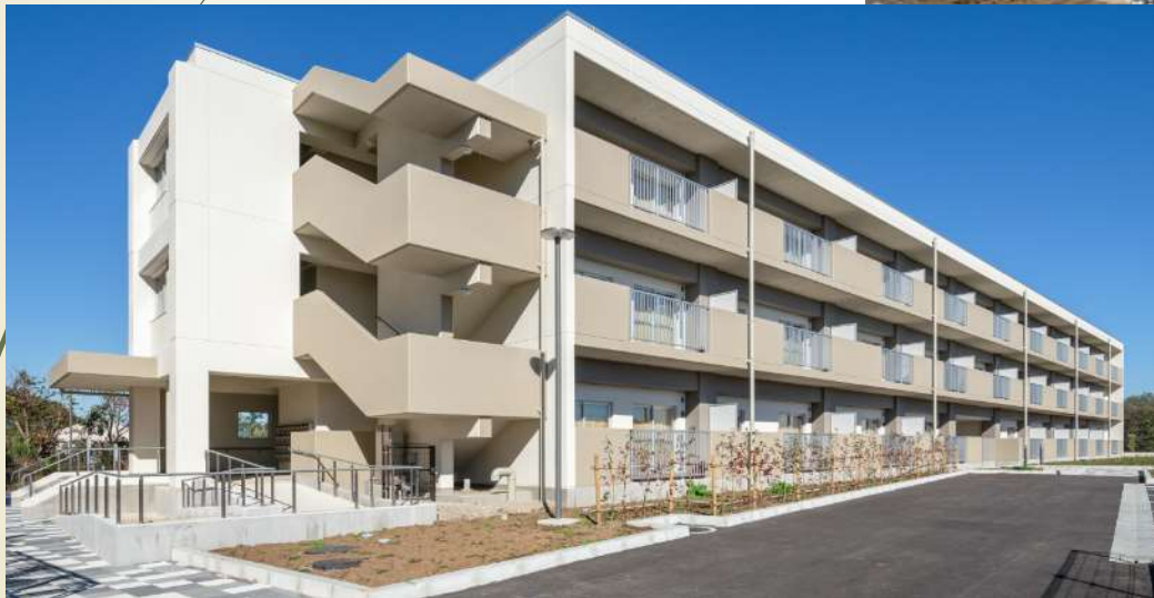
佐津間県営住宅 【令和3年度竣工】