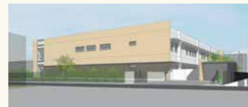
銚子児童相談所イメージ

こどもの福祉に特化した児童福祉専門職員を配置しているのが千葉県の特徴です。児童福祉を志す人にとっては、やりがいのある仕事や意欲を持って安心して働ける環境があり、これまでの学びや経験を余すことなく活かすことができるでしょう。こどもたちの未来のために私たちと一緒に働きませんか？