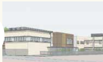
(仮称)東葛飾児童相談所イメージ