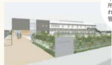
(仮称)印旛児童相談所イメージ