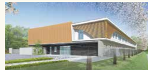
柏児童相談所イメージ

建物の老朽化が進んでいる児童相談所について、こどもの最善の利益を考え、より行き届いた支援ができるような一時保護環境の充実と、職員同士や関係機関との連携が行いやすいような執務環境の向上等のため、令和9年度中の建替えを予定しています。