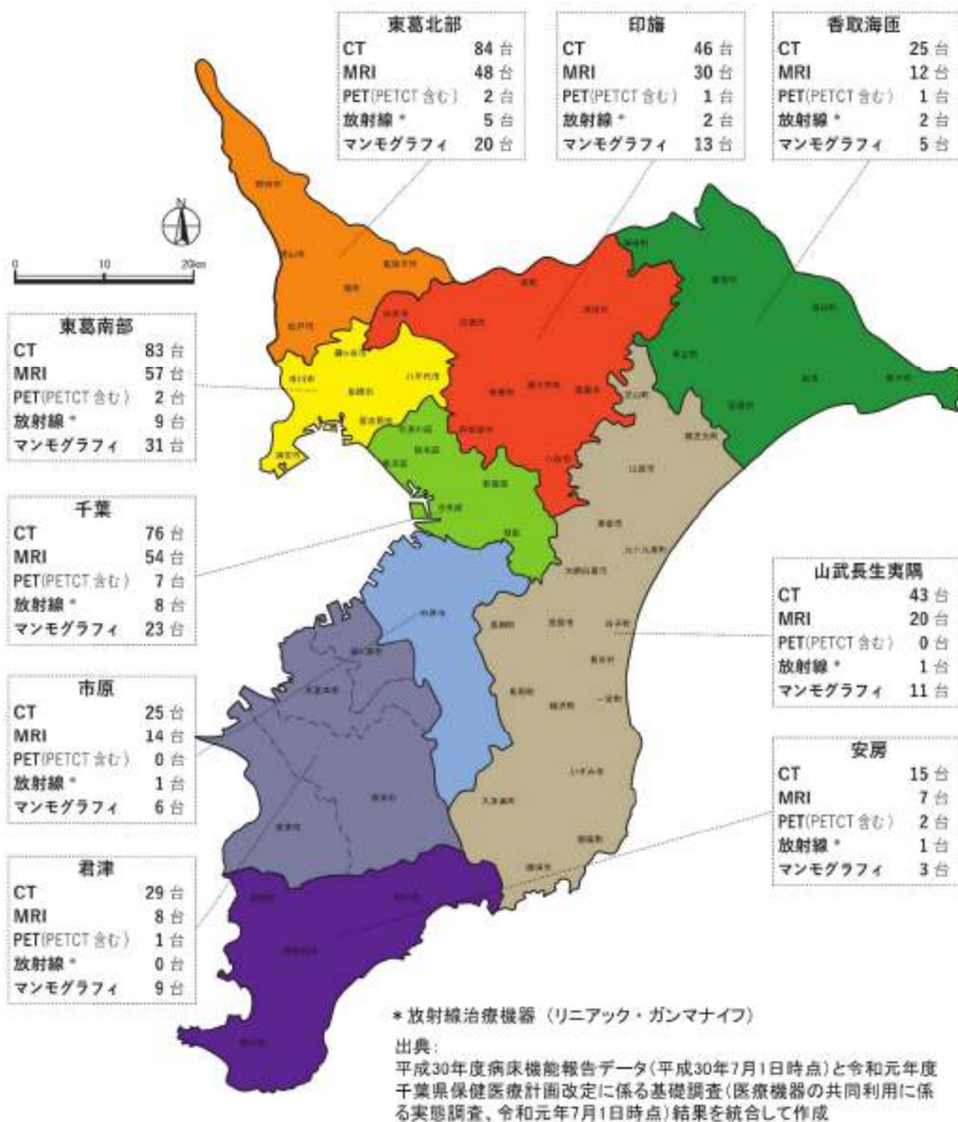
図表 2-3-1-1 医療機器の配置状況マップ