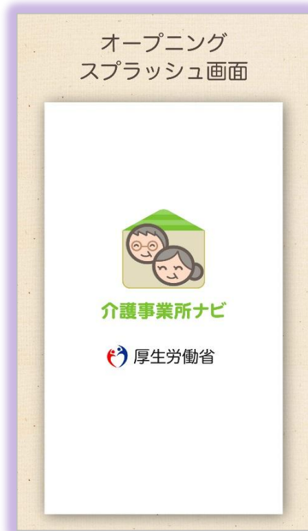
厚生労働省のクレジット