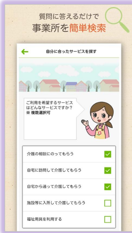
介護サービスに詳しくない方には質問形式で誘導