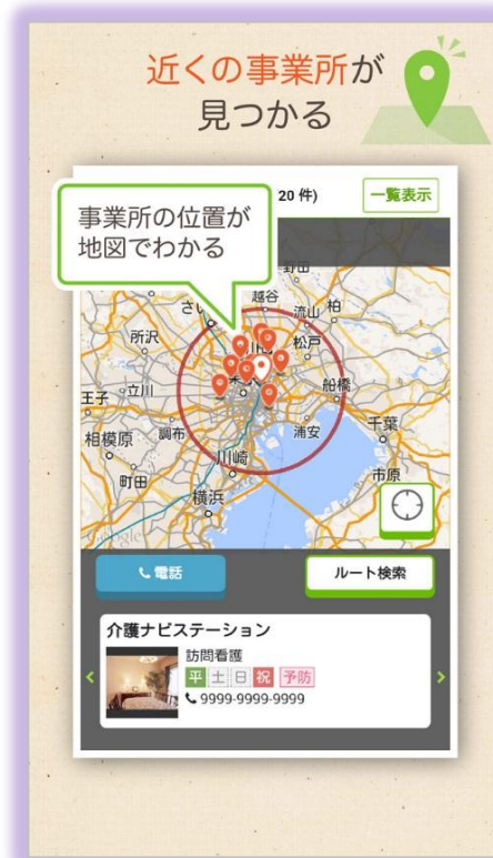
現在地からの距離や道順が分かる