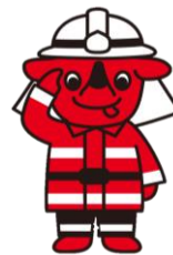
千葉県マスコットキャラクター チーパくん