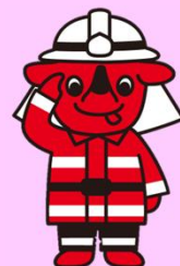
千葉県マスコットキャラクター チーぱくん