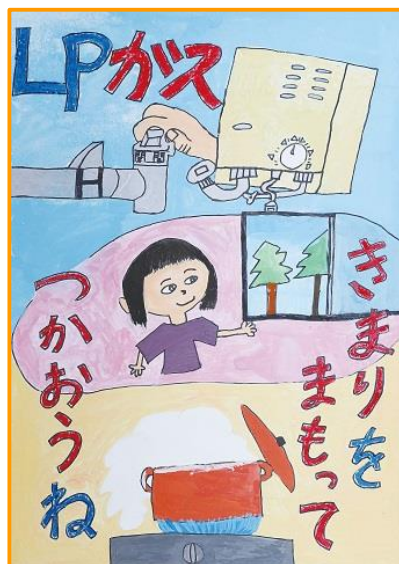
小学校高学年部門