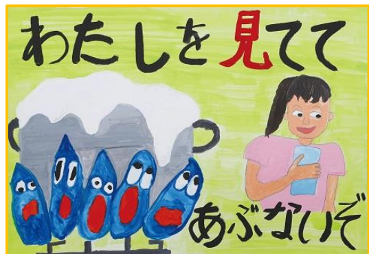
小学校低学年部門