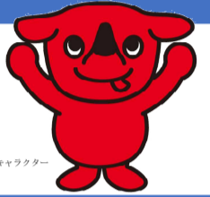
千葉県マスコットキャラクター「チーバくん」