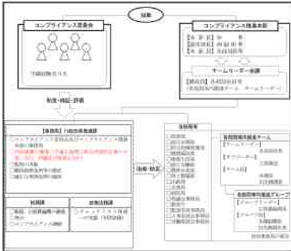
【推進組織の全体像】