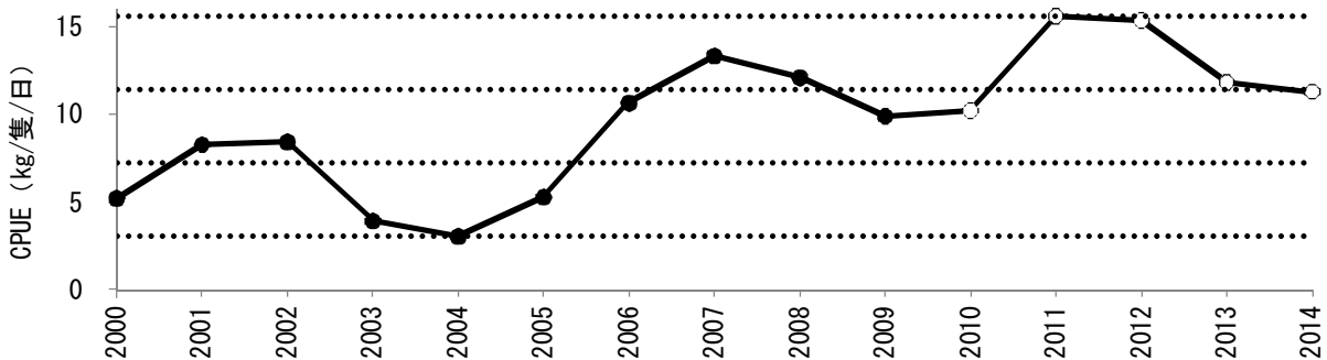
サザエ主要地区刺網漁業CPUEの経年変化