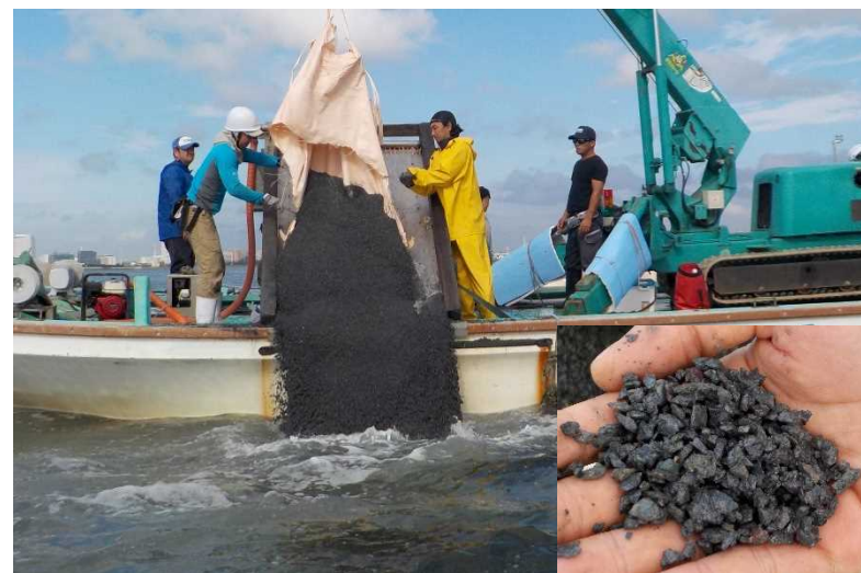
図 2 客土 (碎石覆砂) 実施状況 (船橋市漁業協同組合活動グループ)