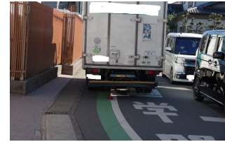
狭くても相互通行