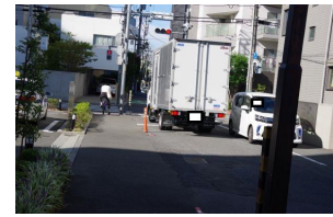
歩行者・自転車・車の分離で安全安心