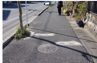
流山市野々毛3丁目急坂歩道: 自転車減速、歩行者も安全安心