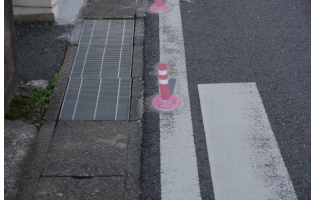
流山市私道から幹線道路: 安全安心