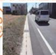
プレキャスト側溝