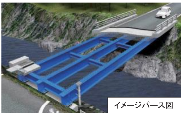
イメージパース図