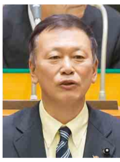
民進党 天野 行雄 議員 (千葉市稲毛区)