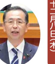
民進党 石井 敏雄 議員 (八千代市)

学習指導要領の改訂と小中学校の英語教育の充実 ナガエツルンゲイトウほか困りもの対策 印旛沼地域の排水管理 八千代市内の道路・里山活動