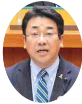
自民党 武田 正光 議員 (流山市)