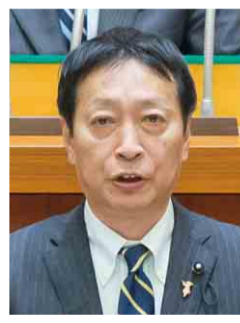
自民党 瀧田 敏幸 議員 (印西市)