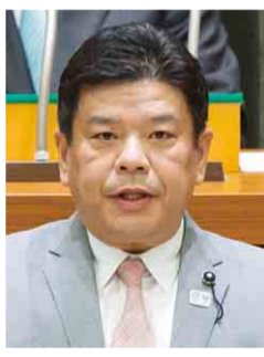
公明党 田村 耕作 議員 (千葉市花見川区)