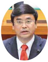
公明党 赤間 正明 議員 (市川市)

サーフィン会場周辺の環境整備 水産業の振興 公衆無線LAN環境の整備 外房地域の交通アクセス