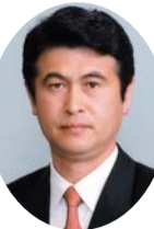
自民党 田中 豊彦 議員