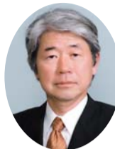
自民党 岡村 泰明 議員