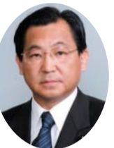
自民党 山中 操 議員