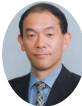
共産党 丸山 慎一 議員