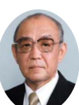
自民党 大塚 堯玄 議員