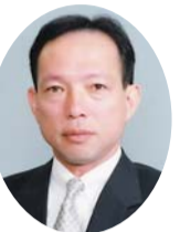
自民党 宇野 裕 議員