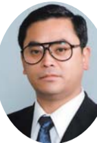
公明党 赤間 正明 議員