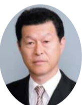
自民党 石橋 清孝 議員