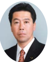
自民党 服部 友則 議員