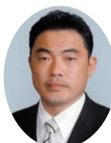
自民党 渡辺 芳邦 議員