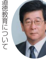
自民党 内田 秀樹 議員