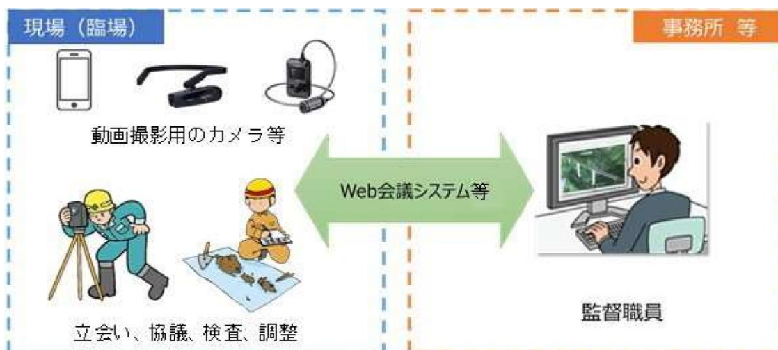
図 3-1 機器構成 (例)

なお、Web 会議システム等については、公共工事、公共発注機関等で活用実績があるなど、十分な情報セキュリティが確保されたものとする。