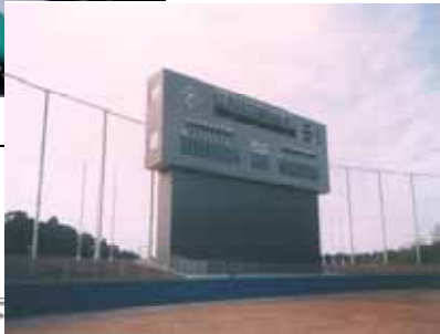
バックスクリーン