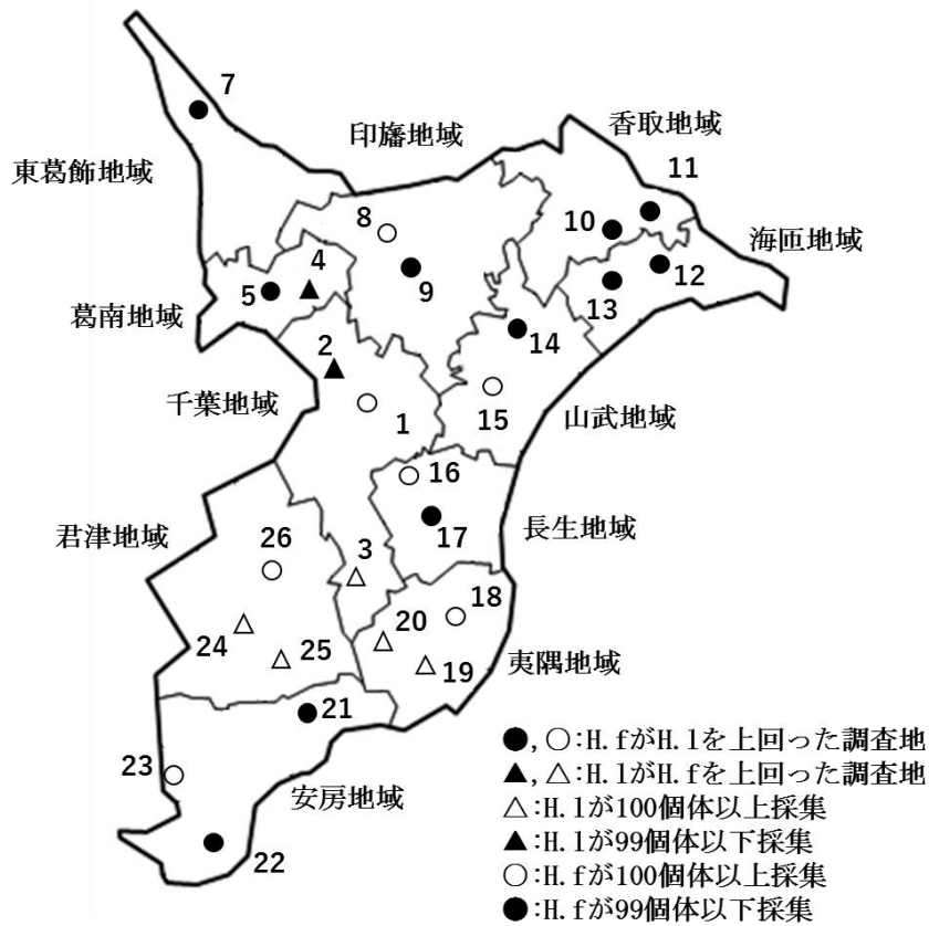
図-2. フタトゲチマダニ (H.1) とキチマダニ (H.f) の採集地と採集状況