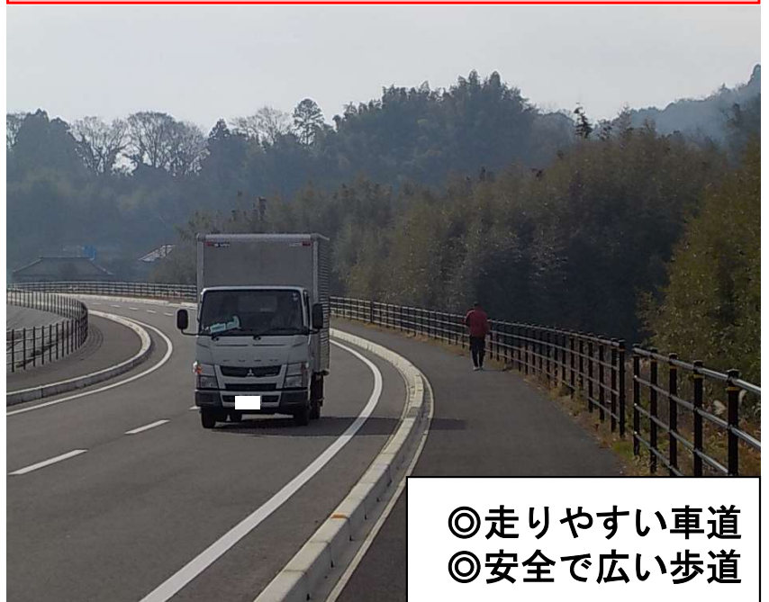
国道410号久留里馬來田バイパス