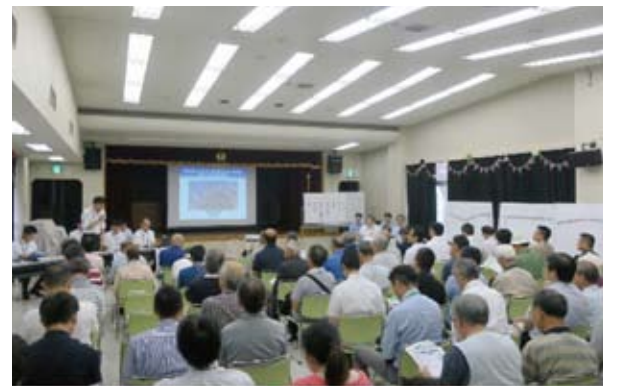
開催状況 (令和元年7月6日 松戸市東部市民センター)

連絡調整会議等の会議資料や、これまでに公表した方法書等の図書、北千葉道路だより(第1号～第7号)は、千葉県HPでご覧いただけます。