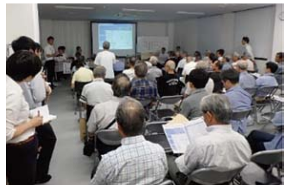
開催状況(平成30年8月29日 市川市・道の駅いちかわ)

連絡調整会議等の会議資料や、これまでに公表した方法書等の図書、北千葉道路だより(第1号～第4号)は、千葉県HPでご覧いただけます。