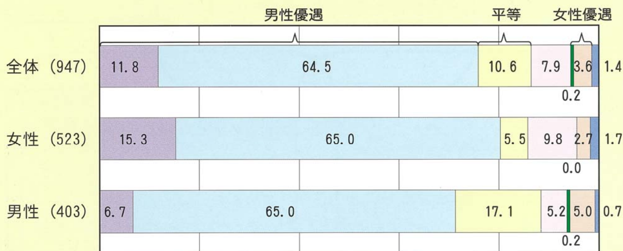
男女の平等意識・社会全体で (%)

また、女性の人権については、男女ともほぼ同じように認識していることがわかりました。