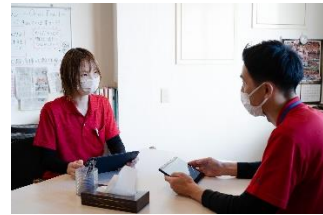
2021年からの3年間で女性の管理職比率は30%から45%へ、通所介護の所長職も4名から8名へと倍増している。

女性が中心の介護業界。DSセルリア株式会社も例外ではなく、従業員の約70%が女性です。そんな女性従業員に一層活躍してもらうため、管理職への登用を積極的に推進。2021年からの3年間で女性の管理職比率は30%から45%へ、通所介護の所長職も4名から8名へと倍増しました。初の女性取締役も誕生し、エンゲージメントの推進を統括。産休・育休・復職の窓口も担当しており、女性従業員からも「女性なので気持ちを理解してもらいやすく、産休などの相談や調整がスムーズになりました」との声が挙がっています。