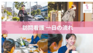
ホームページで施設の日常を伝える動画を配信。情報発信を始めてからWeb経由での求人応募件数が2.6倍に。

『介護業界で働くことを考えている女性や復職を検討している資格保有者に、職場の生の声と姿を伝えたい』そんな想いからホームページ内に動画コンテンツを用意。代表メッセージをはじめ、すでに約100本もの動画がアップロードされています。情報発信を始めてからWeb経由での求人応募件数が2.6倍に。さらには、就業意欲が高い状態で事業所見学や面接を行うことが可能になりました。動画をきっかけに就業した従業員からは「求人サイトの情報だけでは実際の雰囲気はわからないので、動画での生き生きとした姿がとても参考になりました」との声がありました。