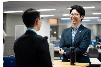
男性従業員が気兼ねなく育休を取得できる空気感の醸成に加え、スムーズに復職できるよう連絡担当者を配置。

管理職をはじめとする全従業員に「現在は男性でも育児休業を取得することが当たり前」との認識を持ってもらえるよう、社内イントラネットにおいて男性向け育児休業に関する情報を発信。理解が進むとともに取得率が大幅に向上しました(令和5年度の50%から、令和6年上半期100%へと向上)。男性従業員が気兼ねなく育休を取得できる空気感の醸成に加え、スムーズに復職できるよう連絡担当者を配置。休業中の会社に関する情報などをつぶさに伝え、取得時も取得後も安心して働き続けることのできる環境づくりに努めています。