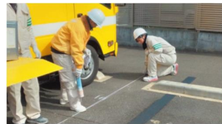
工事現場においても女性従業員を初めて起用し、作業後の片付けなど現場の環境改善において、女性ならではのアイデアが活かされている。

日本都市では従業員の個性・能力を最優先し、性別にかかわらず適材適所で配属しています。工事現場においても、作業後の片付けなど現場の環境改善において、女性ならではのアイデアが活かされています。実際に働く女性従業員からも「力仕事以外の部分で、積極的に仕事を任せてくれることにやりがいを感じています。これからも女性でも現場で活躍できるということを、私自身が率先して示していきたいと思います」と前向きな声がありました。