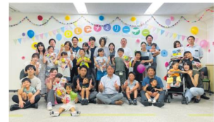
全社的に取り組んでいる「DLファミリーデー(子ども参観日)」。 千葉支店では、産休・育休中の従業員に参加を促している。

親の働く姿を子どもに見てもらうため、全社的に取り組んでいる「DLファミリーデー(子ども参観日)」。千葉支店では独自に、産休・育休中の従業員にも参加を促しています。職場から離れ孤独になりがちな従業員にとって、仲間とのふれあいは最高の気分転換に。また、スムーズに復職してもらうための情報交換に役立っています。参観日にはオフィス内で着ぐるみを着て子どもたちと接したり、千葉公園に出かけてボール遊びをしたりと、すべての従業員にとって非日常を楽しむ機会にもなっています。