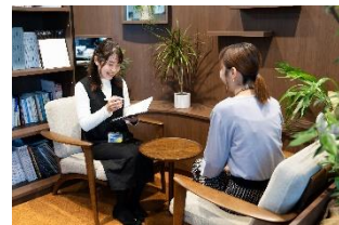
生理休暇の名称を改めるとともに、女性リーダーが申請を 仲介することで従業員の心理的ハードルを下けている。

女性特有の身体や体調の課題について、職場全体で理解しサポートする体制を整えています。たとえば、2022年に生理休暇を「M休暇*」へ改称し、より申請しやすい環境を構築しました。とくに千葉支店は、女性管理職が初めて配置された部署があったこともあり、直近2年間で、申請者数が大幅に増えています。また、部門長が男性の場合は、女性リーダーが申請を仲介するといった配慮も。申請への心理的ハードルをさらに下げるとともに、すべての女性従業員へ女性特有の健康課題について相談しやすい環境を提供しています。