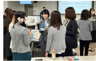
千葉県内の他の企業との異業種交流。活躍する女性たちの意見や、新たな視点を得ることにつながっている。

女性活躍の推進のため、女性従業員が今後のキャリアプランについて考えるセミナーや女性従業員を部下に持つ管理職向けの研修などを実施。加えて、女性従業員が指導的役割を果たす未来に向けて、県内の他の企業と異業種交流を推進。社内の意識調査では「高度な専門性の高い業務に就きたい」といった女性従業員の声が増えているほか、昇格・昇進や管理職に対する意識にも変化が表れています。2025年からは交流先を拡大するとともに、全従業員を対象とした研修にも取り組む予定です。