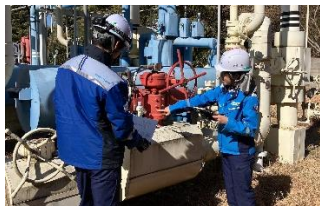
供給設備の維持管理部門など、現場での活躍を希望する女性従業員を積極配置。

女性の活躍の場を広げるには多様なロールモデルを示していくことが必要と考え、これまで男性しか配置されていなかった供給設備の維持管理部門などへ、現場での活躍を希望する女性従業員を積極配置。同じ部署に複数人の女性従業員を配置することで相談し合える環境をつくるなど、働きやすさにも配慮しています。こうした取組を継続することで管理職に占める女性比率のさらなる向上を目指していきます。