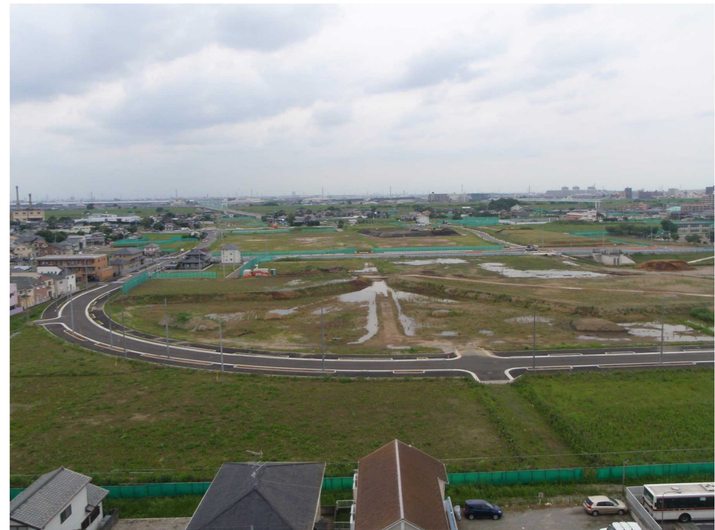
平成23年6月撮影（101街区～107街区を望む）