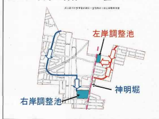
図-1 雨水の幹線ルート図