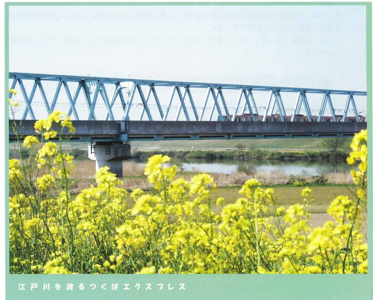
江戸川を渡るつくばエクスプレス