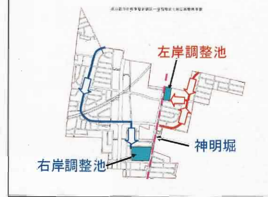
図-1 雨水の幹線ルート図