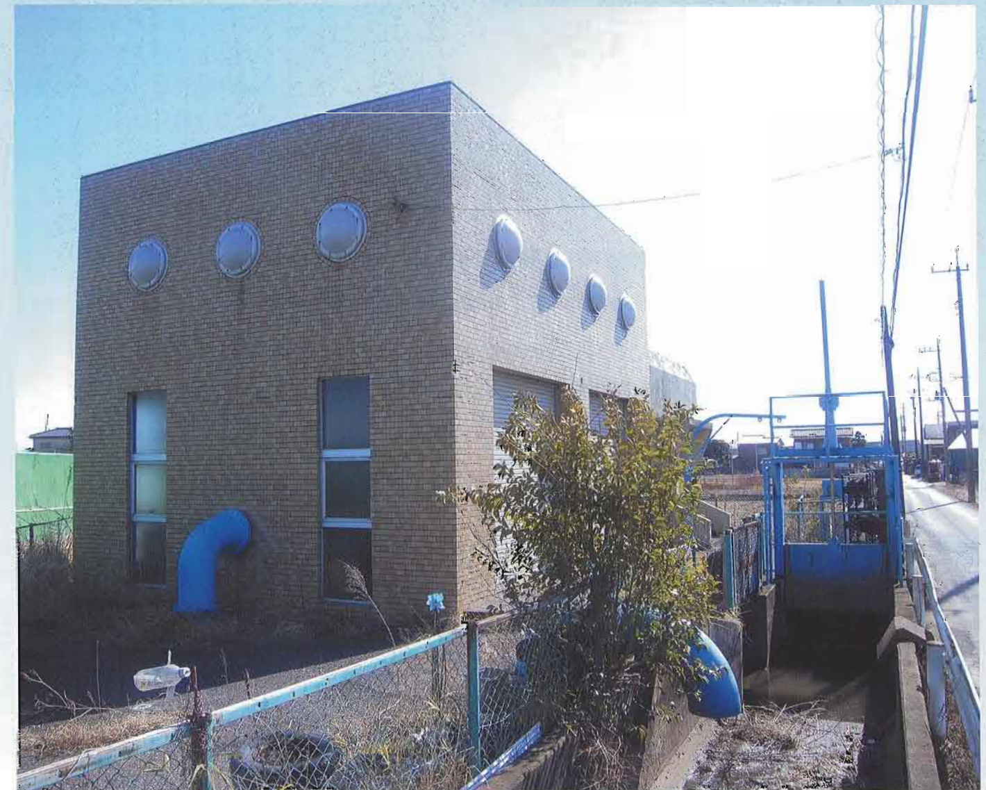
【坂川土地改良区の旧第二揚水機場】