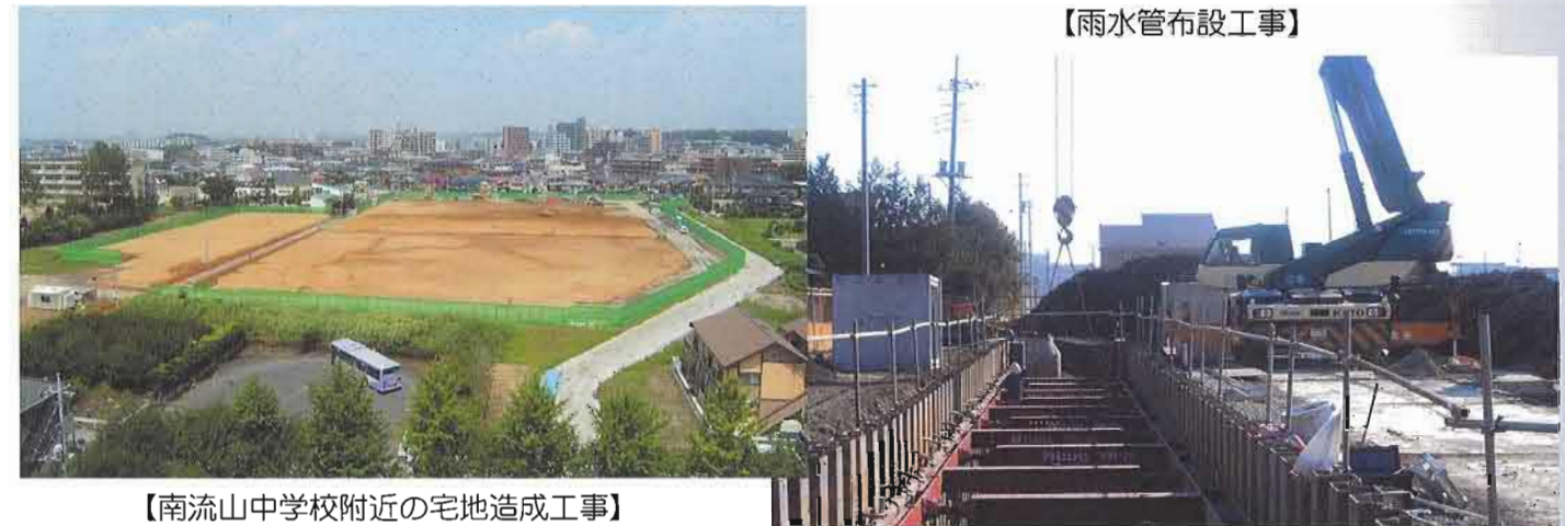
【南流山中学校附近の宅地造成工事】

新たに着手する工事(赤色で着色部分)として、主要地方道松戸野田線の西側地区で、江戸川沿いの集合住宅用地や「つくばエクスプレス線」南側の宅地造成工事に着手します。また、神明堀に架かる残り2本の橋梁工事にも着手します。