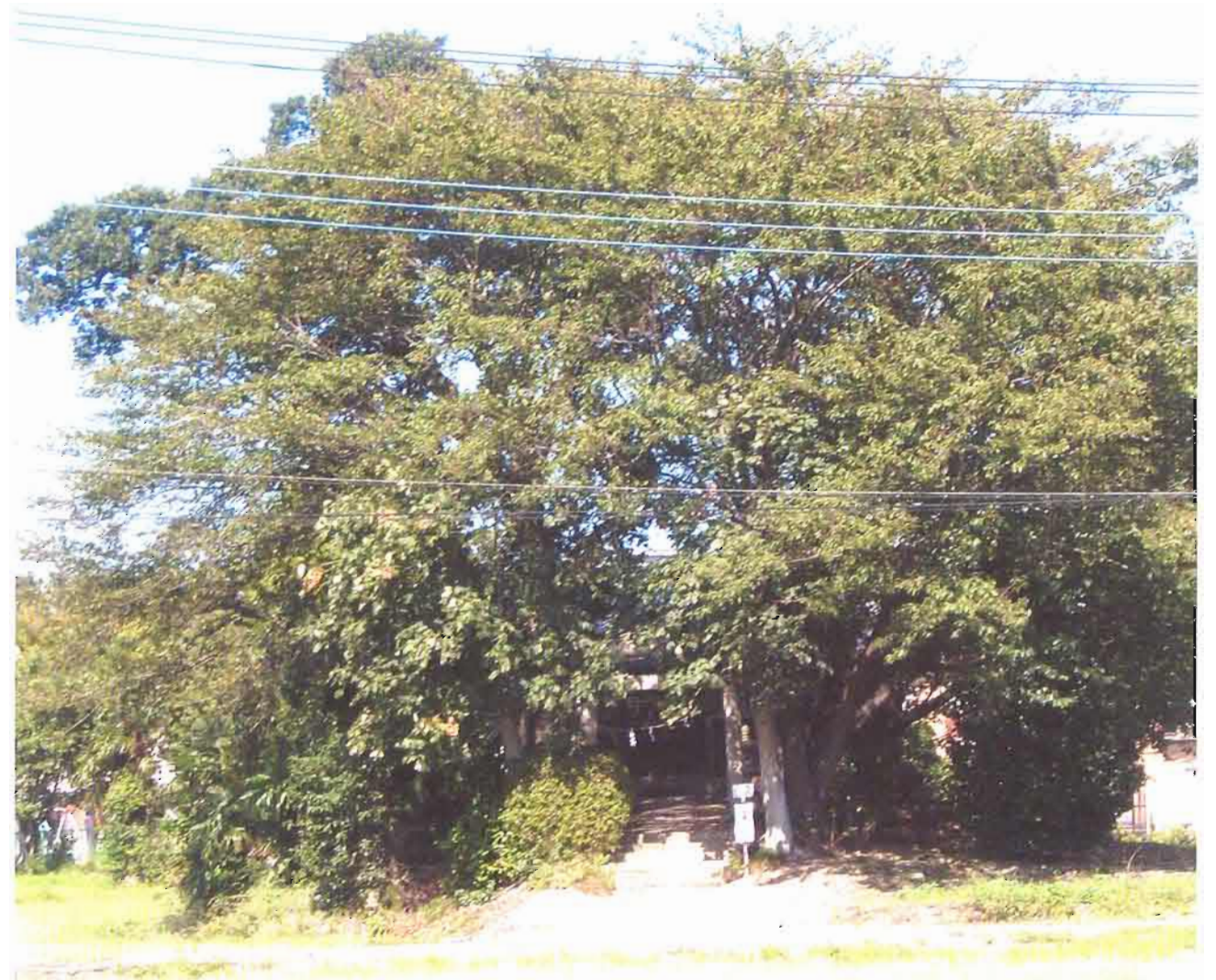
【木地区内にある旧木村(きむら)の神社(豊受神社)】