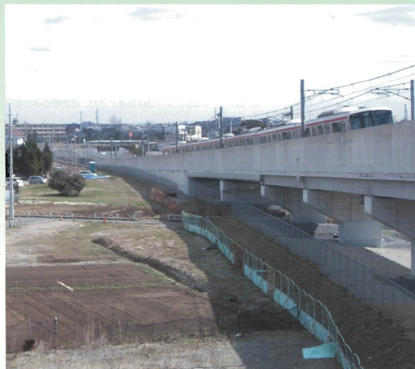
【地区内を疾走するつくばエクスプレス】