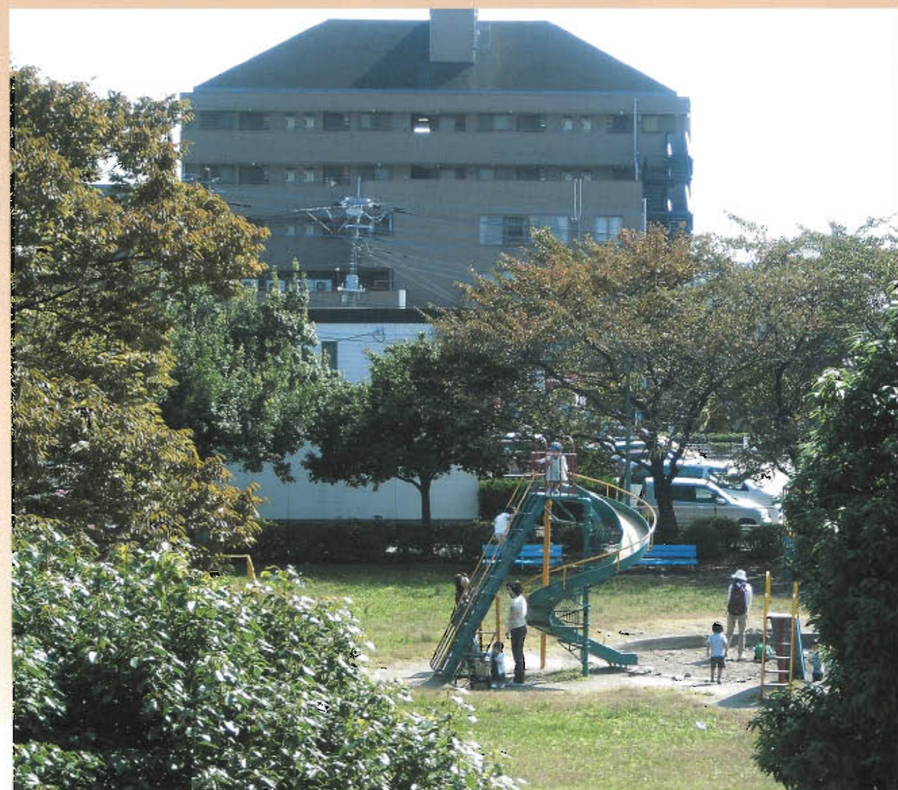
【新しい事務所に隣接する南流山3号公園(カエル公園)】