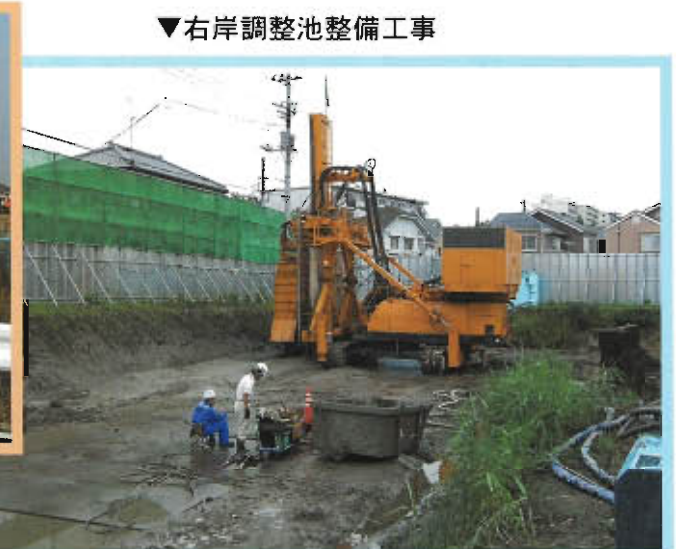
▼右岸調整池整備工事