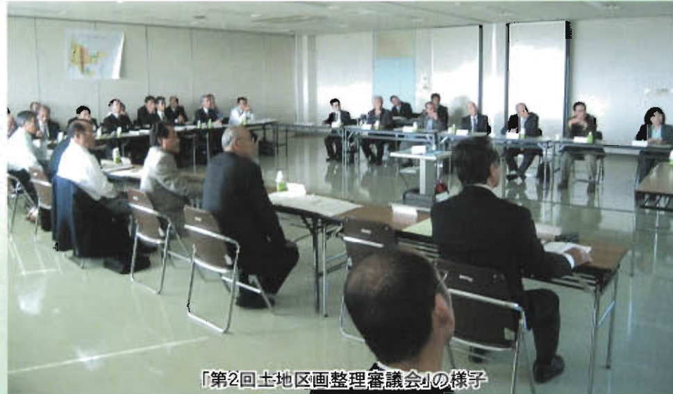
「第2回土地区画整理審議会」の様子

その他、「平成18年度工事の概要」について事務局から説明があり、また、流山市からは「流山グリーンチェーン戦略」について説明がありました。