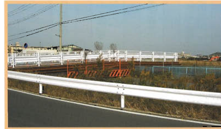
▲神明堀に架けられた仮設橋

なお、事業の展開上、どうしても中断移転をお願いしなければならない方々の仮住まい住宅を右岸調整池南側の4号街区公園予定地に建設します。