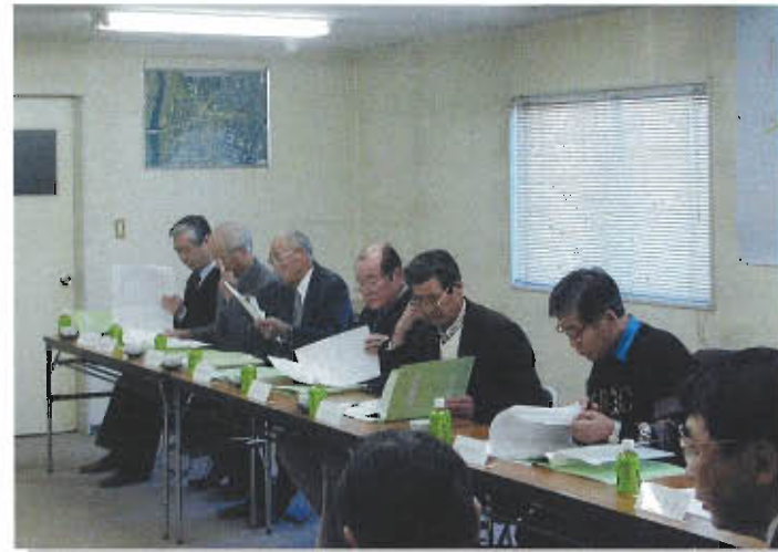
「第1回流山都市計画事業木地区一体型特定土地区画整理審議会」の様子