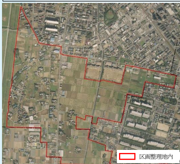
【区画整理施行前の航空写真】