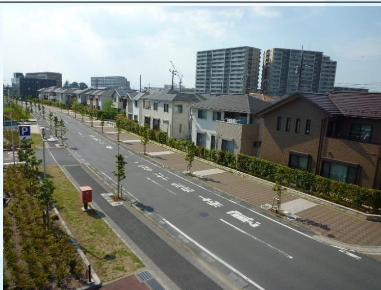
【区画整理後の街並み】