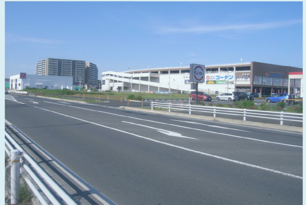
平成28年5月撮影(県道松戸野田線を望む)