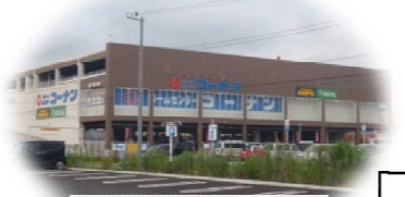
ホームセンター「コーナン」