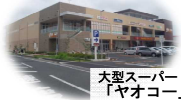
大型スーパー「ヤオコー」