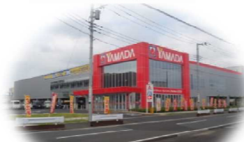
家電量販店「ヤマダ電機」