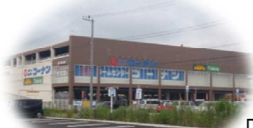
ホームセンター「コーナン」