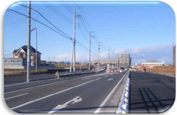
都市計画道路流山上貝塚線 (主要地方道松戸野田線)

【議 題】仮換地の指定、保留地の設定、評価員の選任について諮問し、異議のない旨の答申がされました。