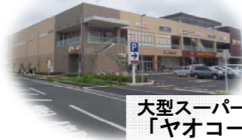
大型スーパー「ヤオコー」