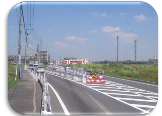
都市計画道路流山上貝塚線 (主要地方道松戸野田線)