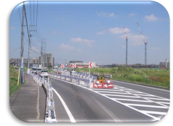
都市計画道路流山上貝塚線 (主要地方道松戸野田線)