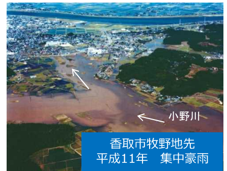
【旧佐原市における主な豪雨に対する浸水被害の推移】