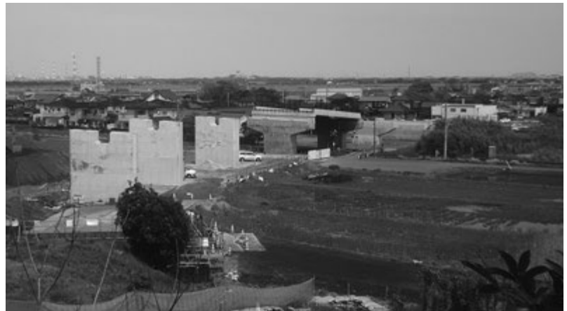
(一) 下総橋停車場東城線 バイパス整備事業

香取市内を流れる小野川は、平成16年にバイパス河川である全長2.19kmの小野川放水路が完成し、旧佐原市街地の浸水被害は大幅に減少した。現在は放水路との分岐点である牧野制水門による洪水の調節や、小野川本川の更なる改修を行い、引き続き防災・減災に努めている。