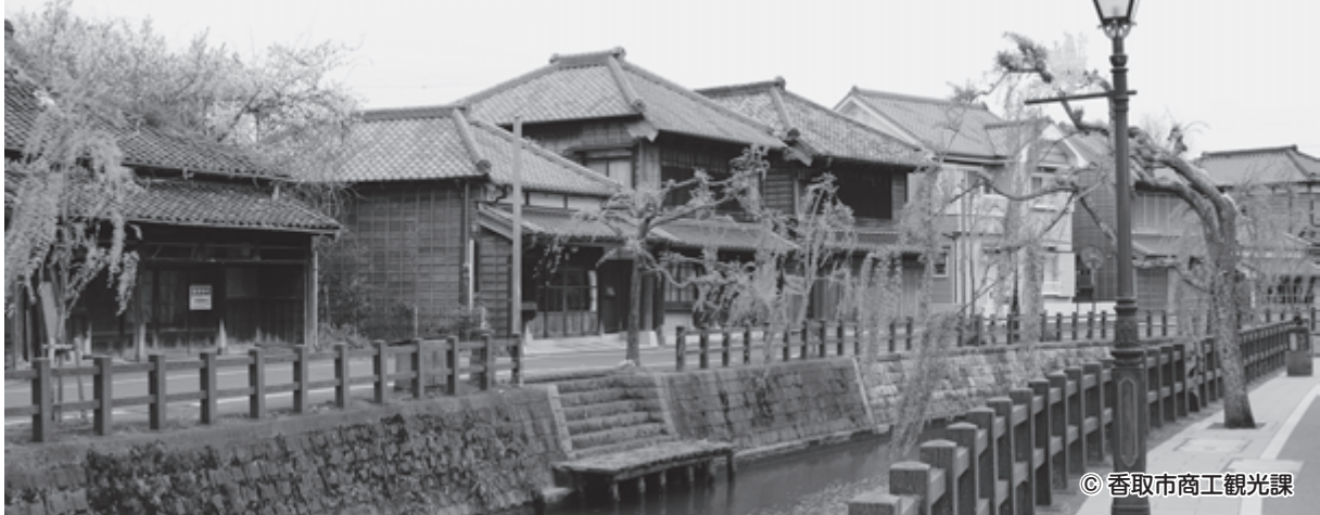
佐原の重要伝統的建造物群保存地区

管内には、水郷・筑波国定公園及び県立大利根自然公園があり、また、香取市を流れる小野川沿いには、古い商家等の歴史的建造物が建ち並んでおり、平成8年には「重要伝統的建造物群保存地区」に指定されるなど、今も水郷情緒を残した自然豊かな風光明媚な地区である。また、平成28年には「山・鉾・屋台行事」のひとつとして「佐原の山車行事」がユネスコ無形文化遺産に登録されたところである。